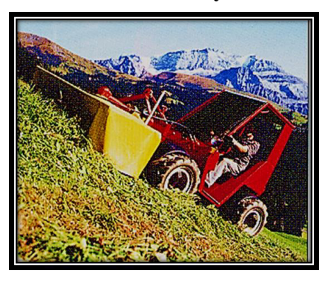
Great tractive capacity, great stability on steep and rough terrain, less slippage and greater protection of the turf