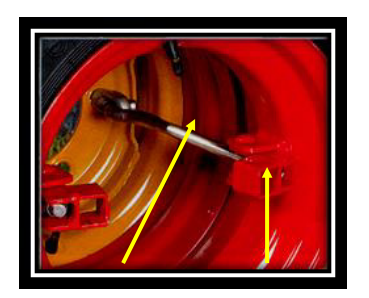
SOK hook bolt with adjustable thread

SOK dual wheels can also be requested in the original colour of your vehicle and already equipped with tyres, ready to be simply installed! The spacer is welded on the external wheel and equipped with SOK clamps. Set up needs just minutes, done by only one person. You just need to insert the dual wheel's spacer into the internal wheel, attach the hook bolt to the SOK ringnuts and tighten with the SOK tube handle.