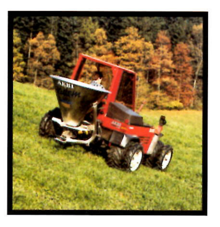
Le ruote gemellate SOK si installano e disinstallano in pochi minuti