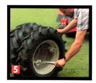
Lo smontaggio non è faticoso: in pochi minuti il veicolo può tornare a percorrere le vie più strette