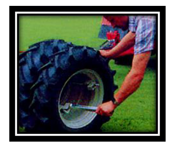
Ultra-rapid mounting and dismounting