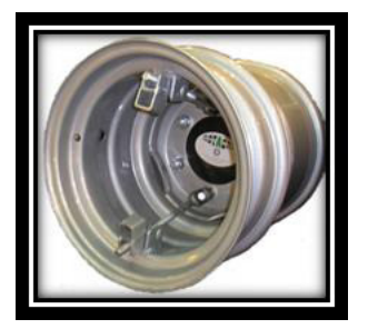
SOK dual wheel, mounted on wheel with adjustable disc