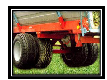
Turf protection and ideal for haymaking works