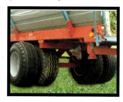
Tutela del manto erboso e maggiore stabilità sul ripido