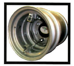
Ruota gemella SOK, installata su ruota a disco variabile