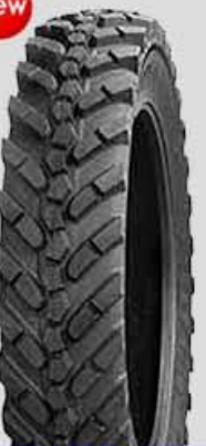
IF 363 Agriflex