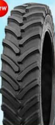
IF/VF 354 Agriflex +