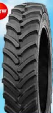
IF/VF 354 Agriflex